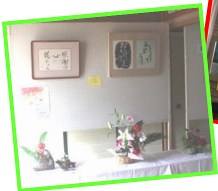
△書道クラブ ・ フラワーアレンジメント