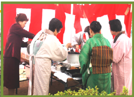
△茶道クラブの野点風景