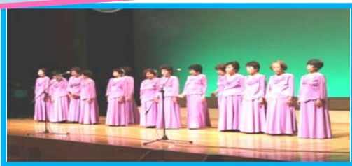
△しらさぎコーラス